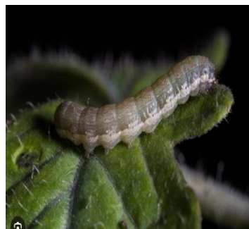
Figure 15 : Chenilles de papillons