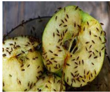
Figure 11 : Mouches des fruits