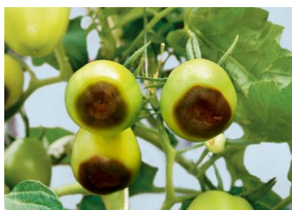
Figure 6 : Nécrose apicale