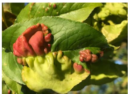
Figure 8 : Champignon Fusarium oxysporum