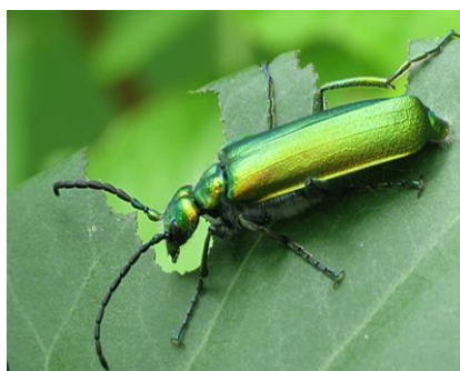
Figure 16 : Cantharide