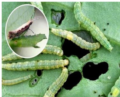
Figure 14 : Teigne des crucifères Source : FERT, 2011