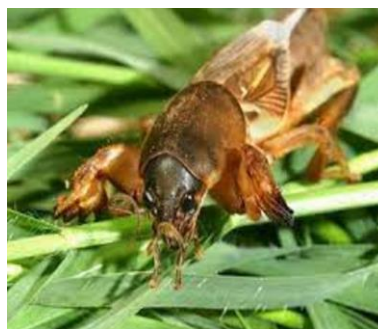
Figure 17 : Courtilière Gryllotalpa africana