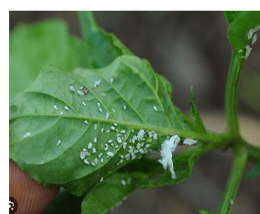
Figure 7 : Cochenilles