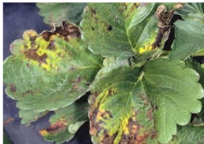
Figure 3 : Pseudomonas et Xanthomonas