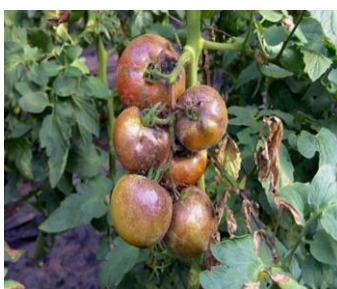
Figure 5 : Mildiou