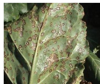
Figure 4 : Cercosporiose