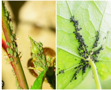
Figure 12 : Pucerons