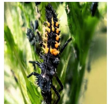
Figure 13 : Insectes souterrains