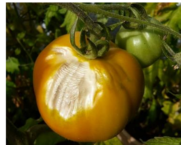
Figure 1 : Coup de soleil