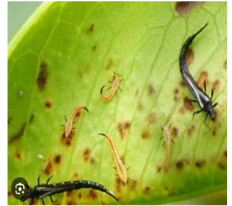
Figure 10 : Thrips